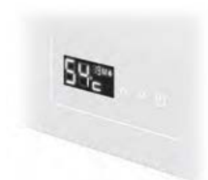
Сенсорные кнопки управления колонкой

серия Sensor работает даже при экстремально низком давлении воды в системе — от 0,01 МПа.