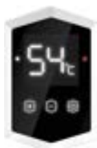
Сенсорная панель управления в виде ромба